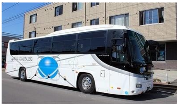
リフト付き大型バスでお花見・定義山などのバスツアー

施設企画だけでなく、法人内の各事業所等と連携して様々な行事に取り組み、お客様へ楽しみ・社会参加の機会を提供しております。